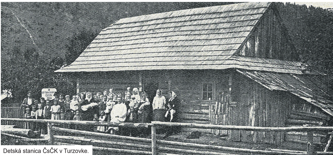
Detská stanica ČsČK v Turzovke.