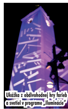
Ukážka z obdivuhodnej hry farieb a svetiel v programe „luminácie“

Hodinu pred polnocou v piatok 29. mája 2015 zažiaril turzovský farský kostol Nanebovzatia Panny Márie v podobách, v akých ho predtým nikto nevidel a aj na tejto udalosti má zásluhu náš Spolok. Za sprievodu organovej hudby menil kostol svoju farebnú podobu, aby ho napokon rozžiariť veľkolepý ohňostroj, ktorý doslova