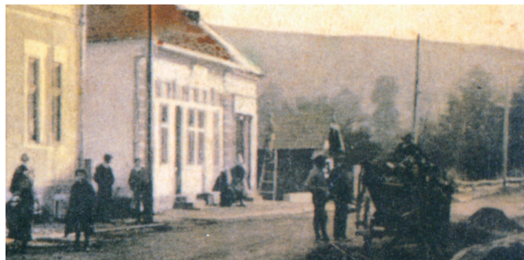
Drevený Barankovský dom v strede, napravo od domu Menkynnu, na dnešnej križovatke Ulice M.R.Štefánika a Beskydskej.