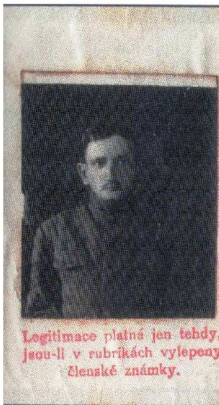
Legitimace platná jen tehdy, jsou-li v rubrikách vylepeny členské známky.